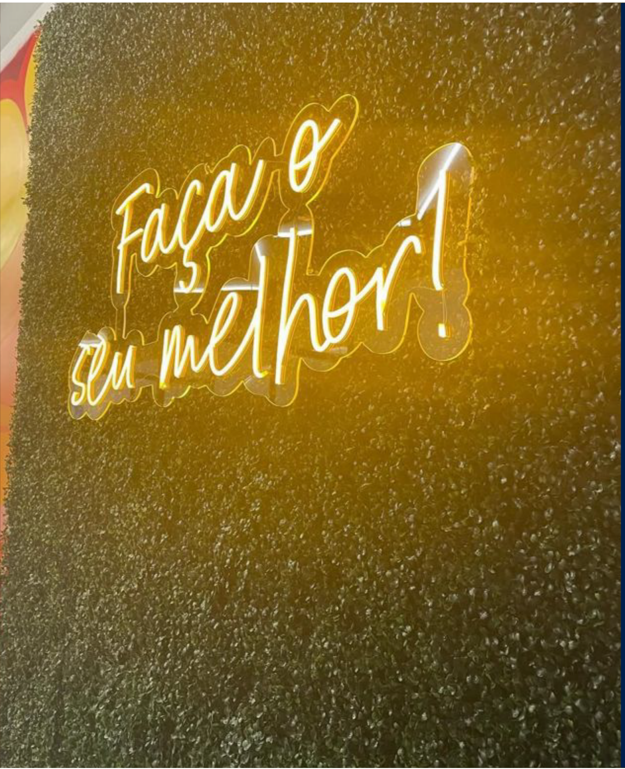
Letreiro em neon Led