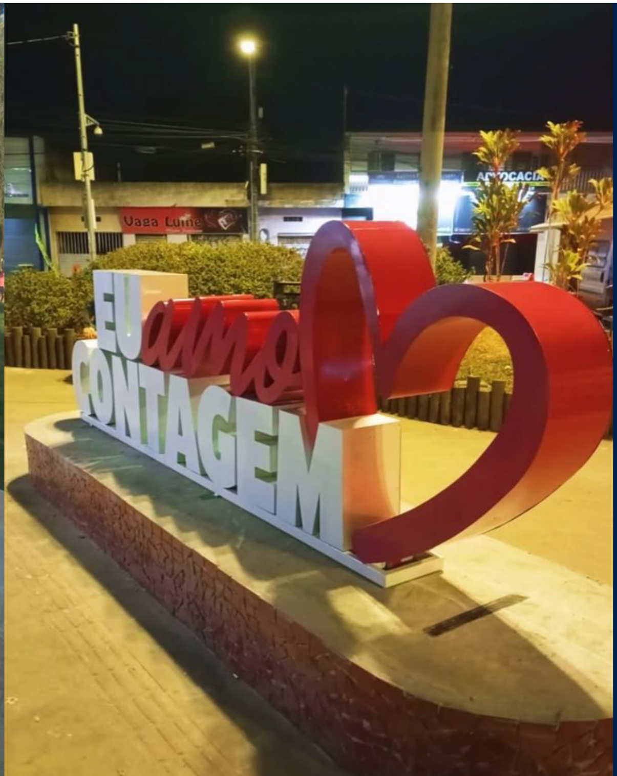
Letreiro com chapa galvanizada