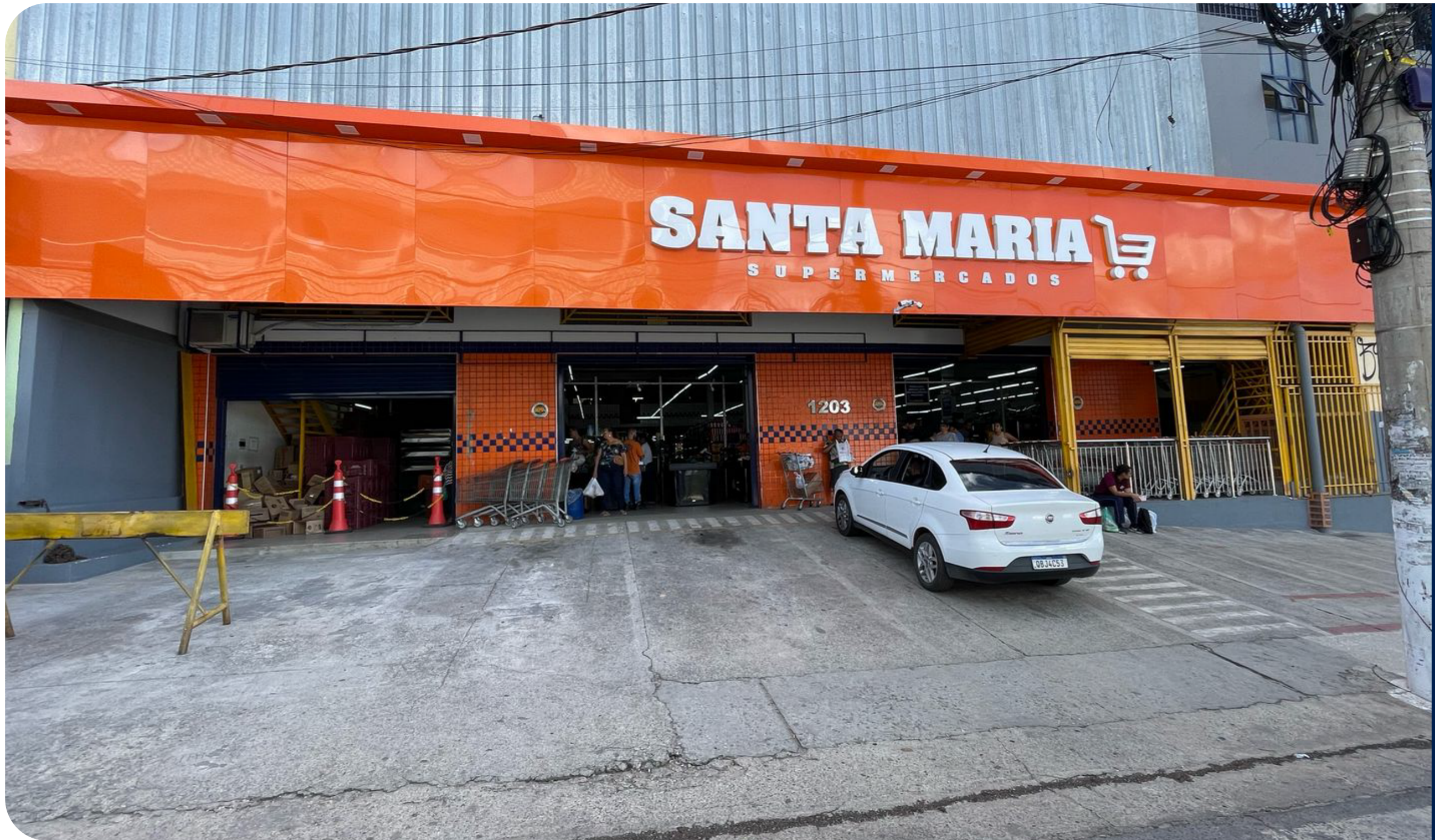
Fachada em ACM e letreiro luminoso