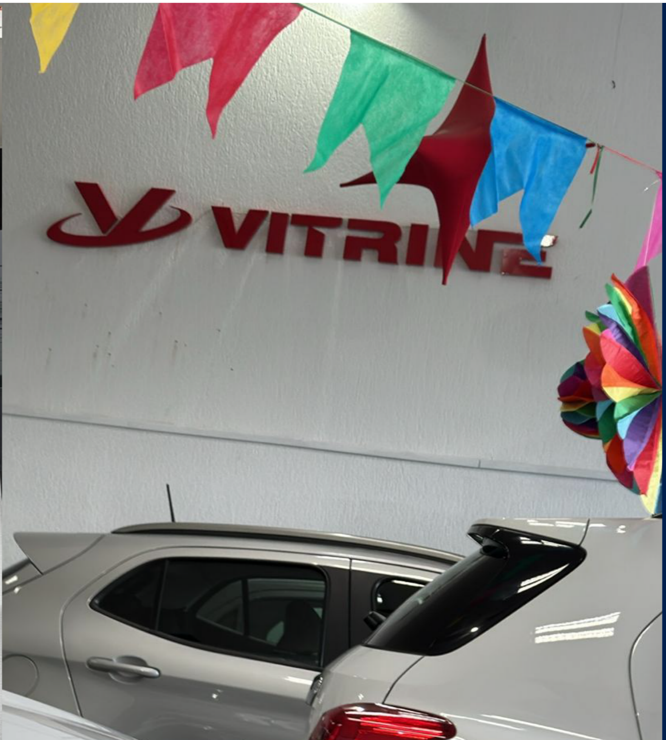
Letreiro em ACM